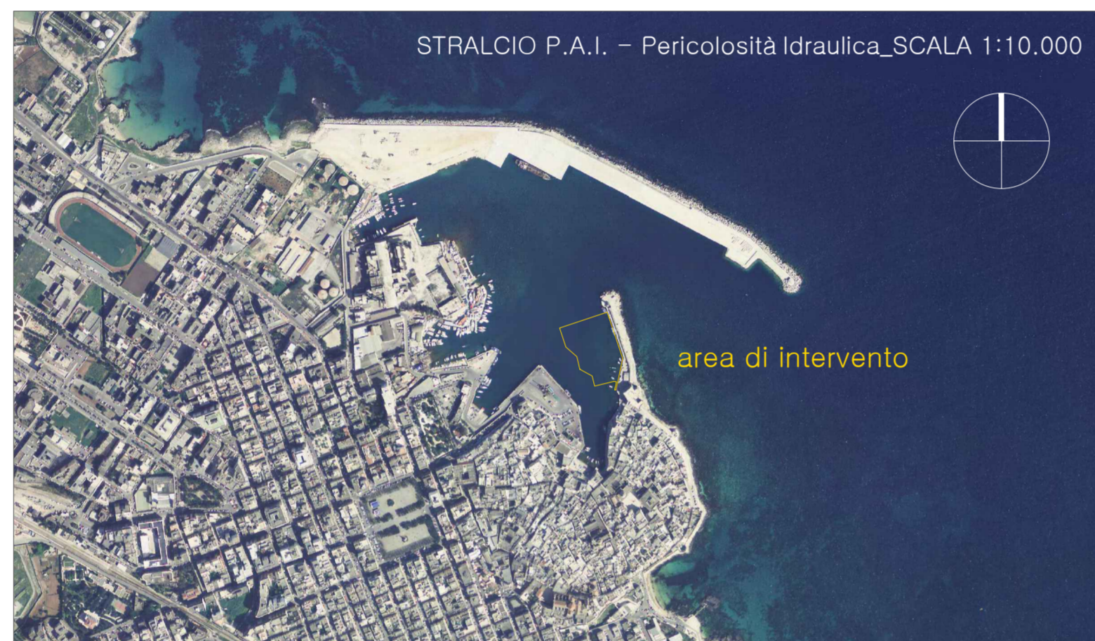
Legenda Pericolosità Idraulica_