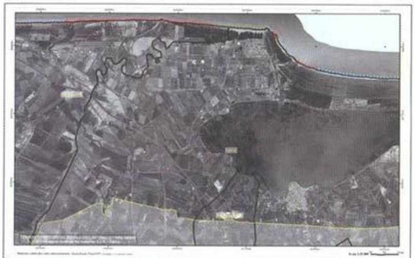
P.R.C. Analisi: Criticità - Sensibilità, UF1

In questa storia, i cittadini sono parte della vita della Costa perché la abitano ogni giorno. E per questo sono tutti protagonisti con la loro conoscenza, nell'esercizio dei propri diritti, ma anche nel rispetto delle regole. L'obiettivo è produrre insieme uno sviluppo sostenibile dei nostri territori.