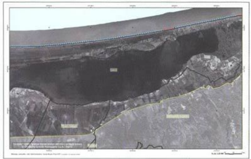
P.R.C. Analisi: Criticità - Sensibilità, UF1

Protegge la Costa come risorsa collettiva, di uso libero e sostenibile. Si basa sulla cooperazione.